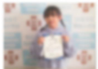
日本スイミングクラブ協会 泳力 3 級 3 年児童 令和 7 年 1 月 4 日