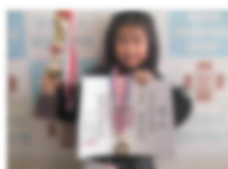
第 56 回全国学生書道展 最高賞 2 年児童 令和 7 年 1 月 13 日